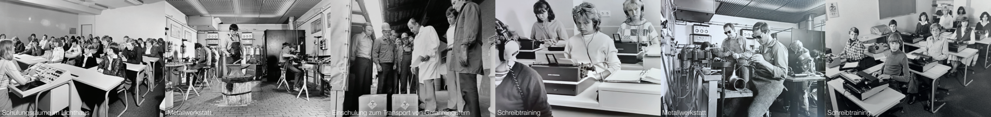
Schulungsräume im Lichthaus